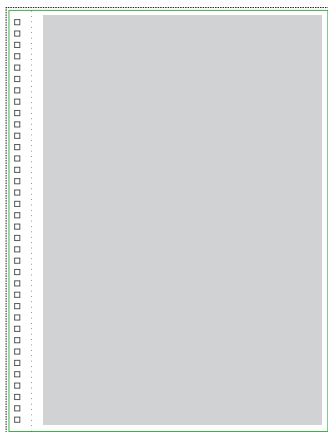
1:1 Vorlage auf Seite 2